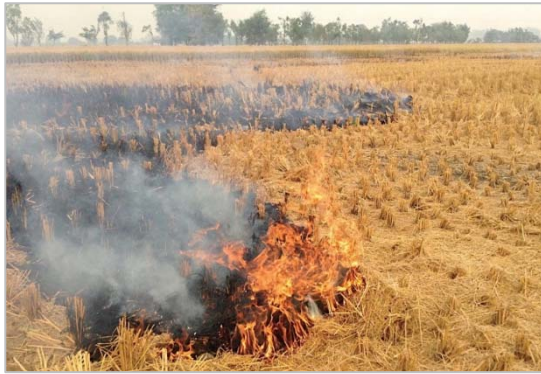
写真1:パンジャブ地方の稲わら焼きの例 (2018年11月4日撮影、林田佐智子)