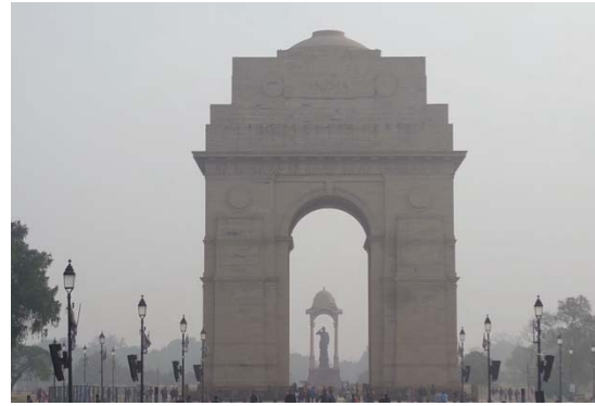
写真2:PM 2.5 の高濃度時におけるデリー首都圏での視界不良の様子 (2023年1月14日撮影)