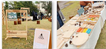
奈良女子大学でのマルシェ開催時の様子

完成した小物には、アオハルプロジェクトオリジナル焼印を押してお持ち帰りいただけます。